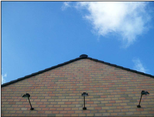
FOTOVRAAG 3. Welke tekst staat net niet op de foto?