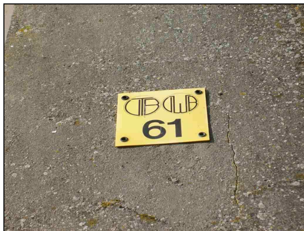
FOTOVRAAG 6. Op welk gebouw is dit aangebracht?