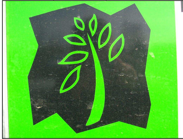
FOTOVRAAG 2. Welke naam van een bijbelse figuur vind je hier terug ?