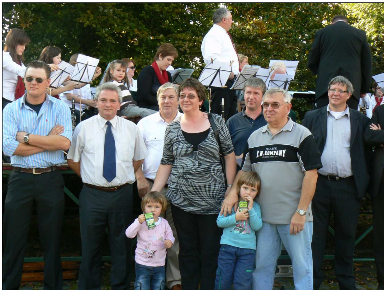
Hoofdprijswinnaars fietzoektocht 2008.