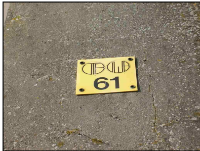
FOTOVRAAG 6. Op welk gebouw is dit aangebracht?