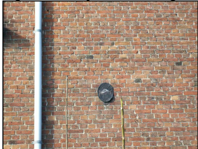
FOTOVRAAG 4. Welke functie oefent de bewoner van dit huis uit?