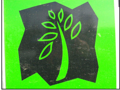
FOTOVRAAG 2. Welke naam van een bijbelse figuur vind je hier terug ?