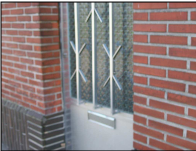
FOTOVRAAG 5. Geef het huisnummer van dit gebouw.