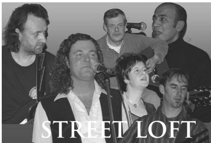
Illustratie 5. De plaatselijke covergroep Streetloft zet op zondagnamiddag met muziek uit het hart de traditie van goede, gekende en genietbare muziek verder.