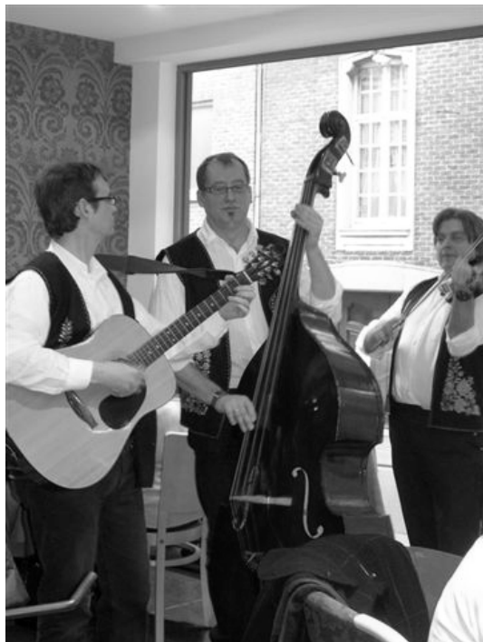
Illustratie 4. Het Wichels Coctailtrio zorgt voor de vrolijke noot tijdens de maaltijd op zondagmiddag 29 juni 2008.

Reken er op dat zaterdag en zondag 28 en 29 juni een heleboel mensen klaar staan om het beste van zichzelf te geven tijdens het jaarlijkse Sint-Pietersfeest!