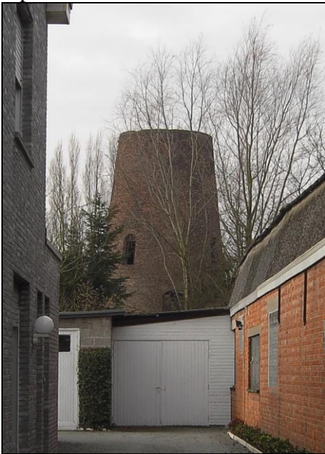
Illustratie 2. De molenromp vanuit de Schriekstraat gezien.

Bovenop de huidige molenromp bevond zich vroeger het gevlucht: de wieken met aanvankelijk een windvang in doek en later in aluminium. Het systeem om de wieken met aluminiumplaten te bedekken, en zo een beter rendement te bekomen, werd bedacht door de Nederlander Dekker. De verdekking van de molen werd in 1933 plechtig gevierd. Een verwijzing naar dat feest was al eens door buur Floris Dhooghe gemaakt, maar onlangs hebben we over dat feest een korte vermelding aangetroffen in een Nederlandse krant, met name het Leidsch Dagblad van donderdag 21 september 1933.