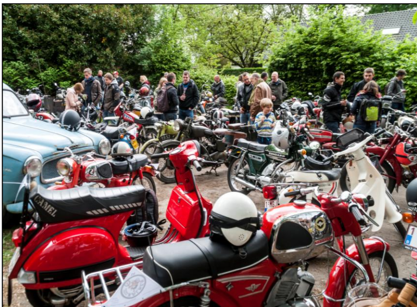
Rustpauze aan herberg 't Gemakske in Laarne, brommerit Molekenskermis 2014.

Voor de tiende keer zal ook de brommerrondrit georganiseerd worden én er is een ruilbeurs in openlucht op de voorhof van Woonzorgcentrum Hof ten Kouter op zondagvoormiddag.