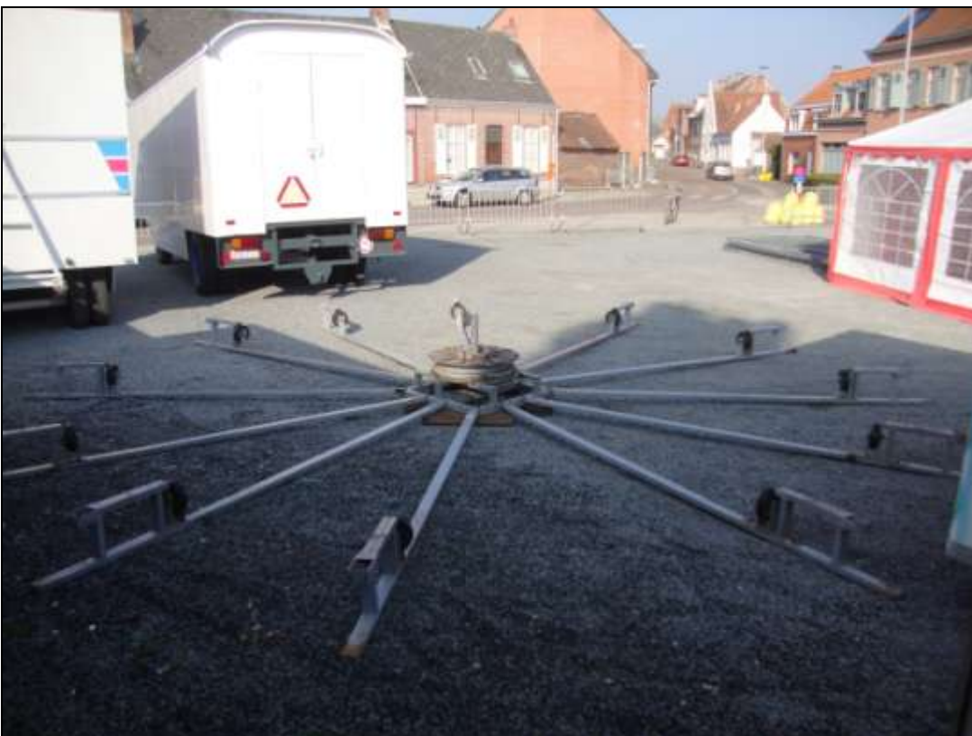
Illustratie 4. Het “traditionele” kindermolentje zullen we vanaf dit jaar missen.

Geen “grote” nood, er komt een andere kinderattractie met wagentjes op rails.