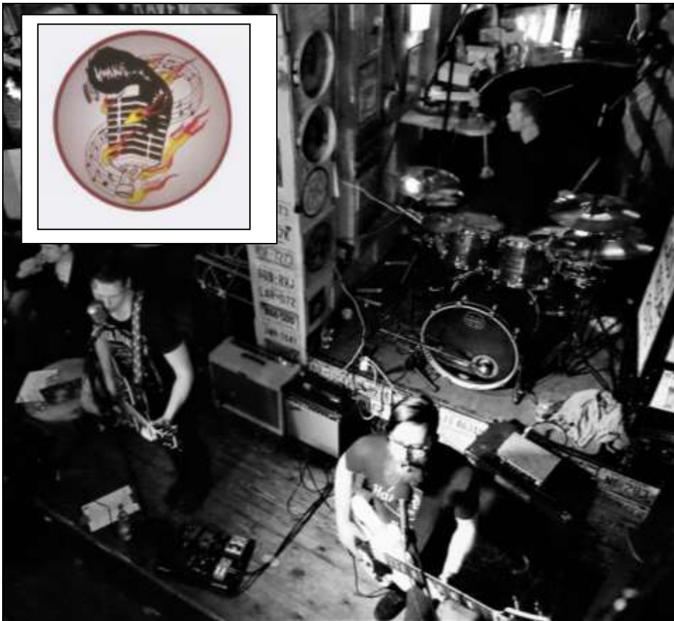
Illustratie 6. De boys van The Flashbacks.