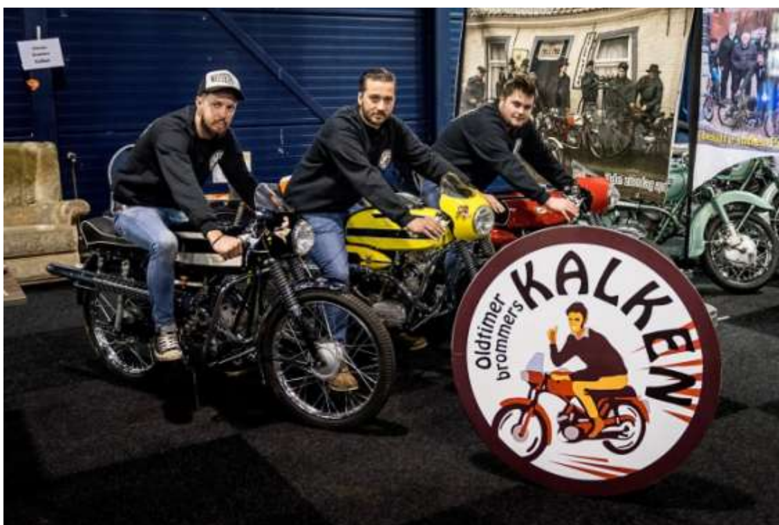
Illustratie 5. De stuwende krachten achter de 11 de oldtimerbrommerrit op de beurs te Rosmalen (Nederland) in januari 2016.

Als afsluiter van de kermisnamiddag geeft de groep The Flashbacks (zie foto voorblad) het beste van zichzelf. Het Oudenburgse rockabillytrio brengt met enthousiasme en een eigen touch de muziek, die je misschien al lang vergeten was, terug tot leven! En dat nodigt uit voor een gezellige babbel en misschien ook wel danspasjes.