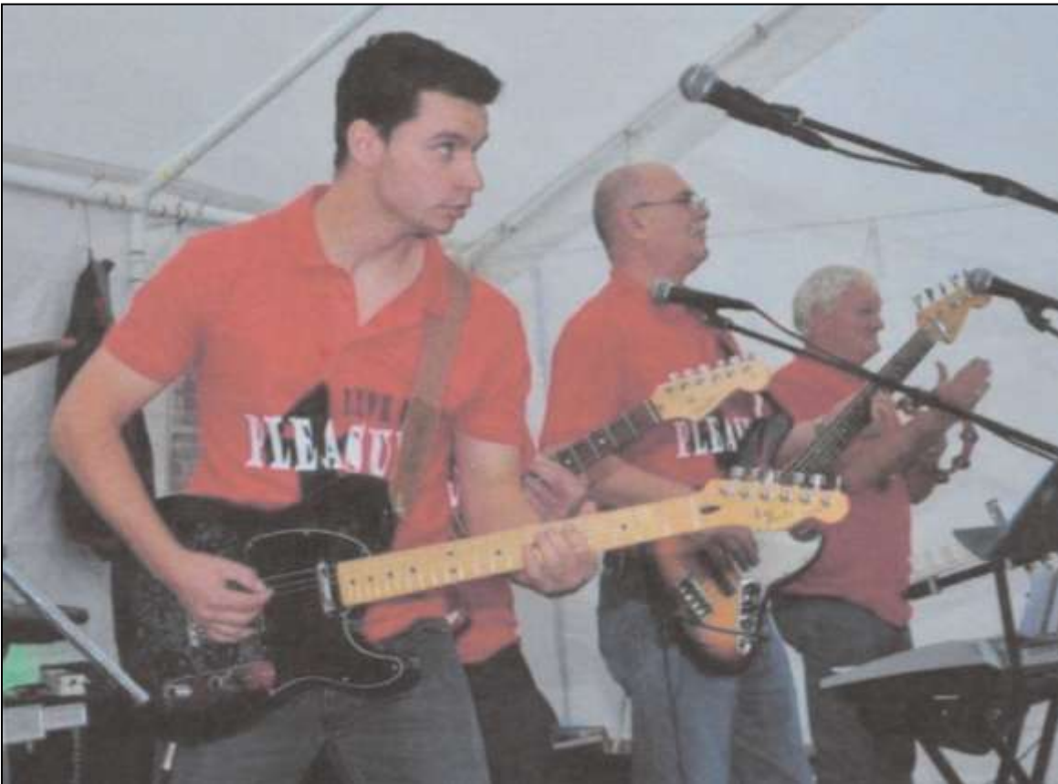
Illustratie 3. De bandleden van 4Pleasure .

van 4Pleasure , een coverband met muziek uit de jaren 1960-1970, uit om de kermis na de wedstrijd op de rodeostier in hun herberg verder te zetten.